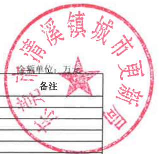
2018年基本支出经济科目分类决算明细表